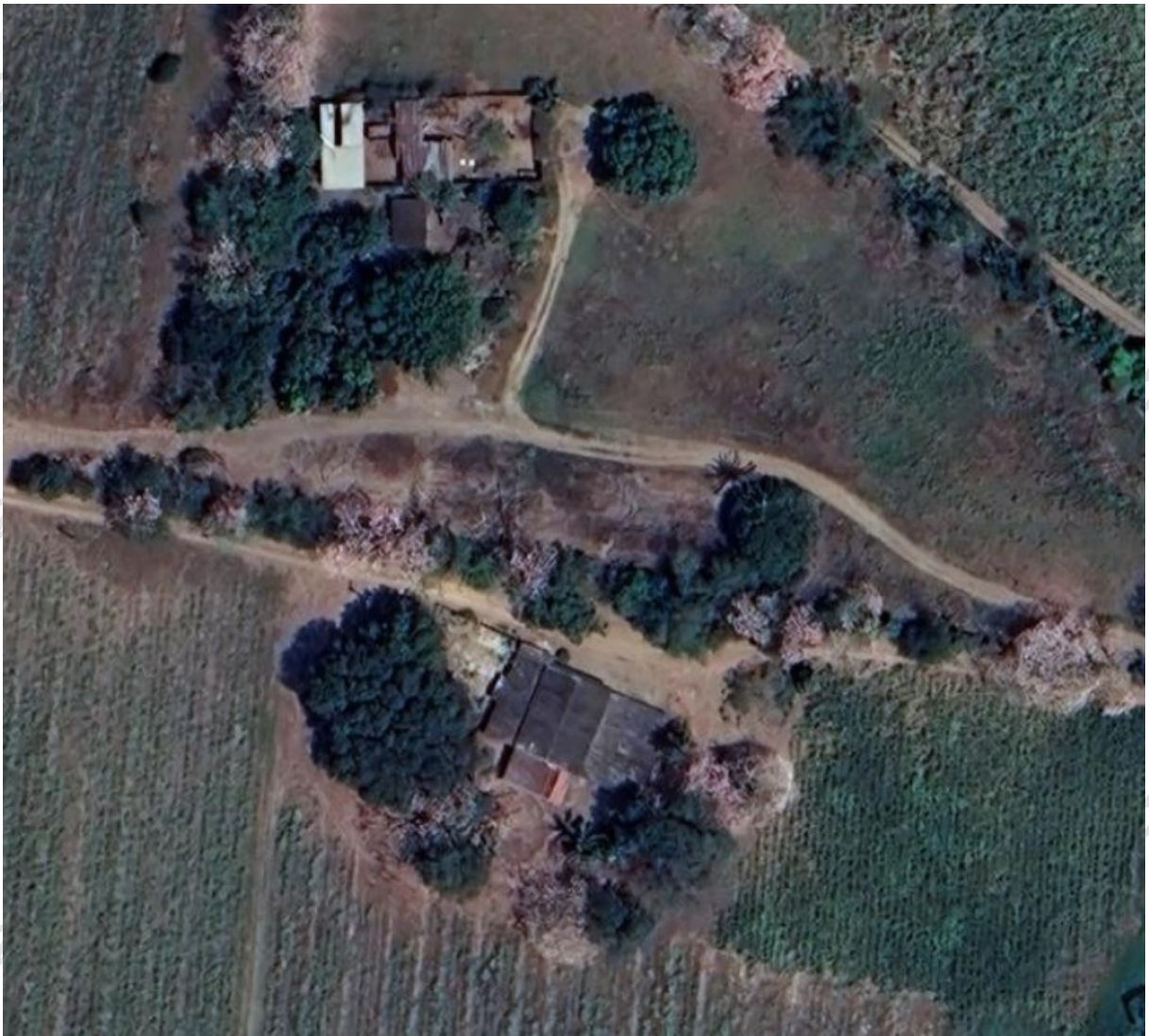
Fig. 4 Vista satelital de la época actual del área donde estuvo ubicado Coapilla.

En el ámbito filatélico, Coapilla es mencionado por Schatzkes como sub oficina del distrito postal de Veracruz, recibió remesas en 1868 y 1872 y muestra 3 cancelaciones, (Fig. 5), también es mencionado por Heath & Stout.