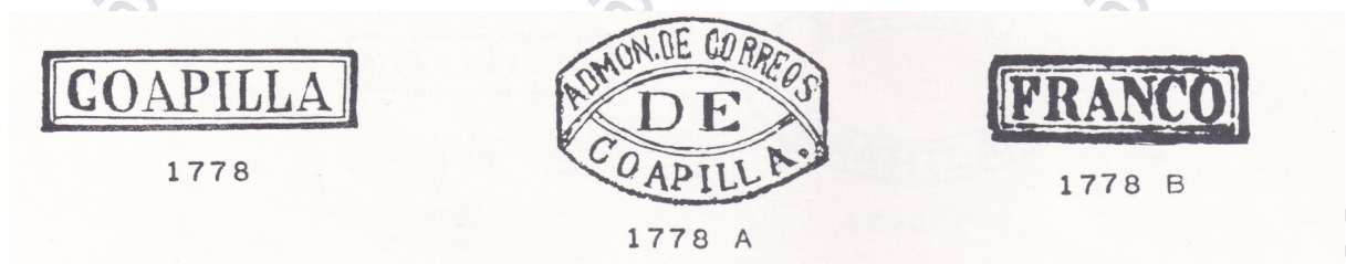
Fig. 5 Cancelaciones de Coapilla, listadas por Schatzkes, su número aparece al calce de cada una.

En el ámbito filatélico, Coapilla es mencionado por Schatzkes como sub oficina del distrito postal de Veracruz, recibió remesas en 1868 y 1872 y muestra 3 cancelaciones, (Fig. 5), también es mencionado por Heath & Stout.