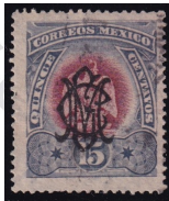
Fig. 2 Águilas 15c 1899