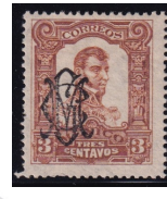
Fig. 5 Independencia 3c 1910