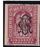
Fig. 7 Transitorios 50c 1914