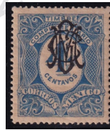
Fig. 4 Complementario 4c 1908