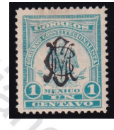
Fig. 8 Denver 1c 1914

Estas imágenes son solo un ejemplo de cada serie participante