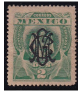
Fig. 3 Águilas 2c 1903