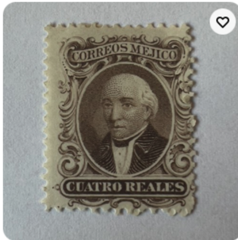
1864 MEXICO 4 REAL MINT MH OG STAMP #16A MIGUEL HIDALGO Y COSTILLA