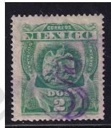
Fig. 3 Águilas 15c 1903