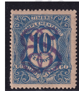
Fig. 4 Complementario 2c 1908