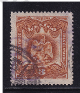
Fig. 2 Águilas 15c 1899