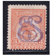
Fig. 8 Denver 15c 1914

Estas imágenes son solo un ejemplo de cada serie participante