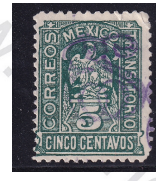
Fig. 7 Transitorios 15c 1914