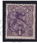
Fig. 5 Independencia 15c 1910