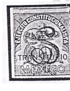
Fig. 6 Ejércitos 1913