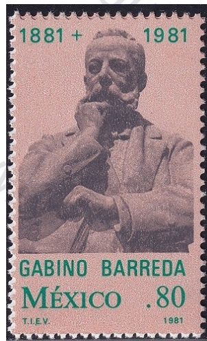
Fig. 1 SC# 1228 (1981)

Cuando en un país atribulado de conflictos, problemas económicos -desorden total en pocas palabras- con dos generaciones padeciendo guerras internas y hasta una invasión extranjera, es como una brisa de aire fresco que los mejores hombres se encuentren y trabajen por el bien común. Hoy platico sobre Gabino Barreda (Fig. 1), un individuo pensante, preparado, con visión a futuro y con sentido de pertenencia a una comunidad, solidario con su país y que logra apuntalar la educación desde el sector público, dejando su país mejor que como lo encontró, a quien Benito Juárez tuvo el tino de acercar a su gobierno, recién restaurada la República, en 1867.