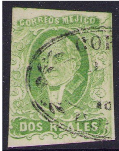
1856 (Colima) Dos Reales Sz 179

Tratando de encontrar el nombre de distrito