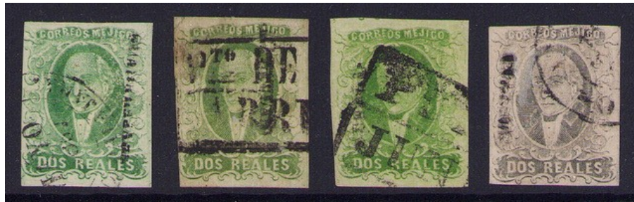
Determinando distrito por medio de la cancelación Guadalajara Sz 297, Mazatlan Sz 739, Puebla Sz 1147 & Mexico Sz 821

el medio de Querétaro. Las letras clave son una de las primeras cosas que busco. Luego están cosas como el largo de la sobreimpresión, como una pequeña, que puede ser Lagos, o una larga, Hermosillo. Por supuesto, el matasellos puede ser la respuesta, especialmente para uno que puedas reconocer de Veracruz o que distingue las letras 'ORIZ' en el buzón común de Orizava.