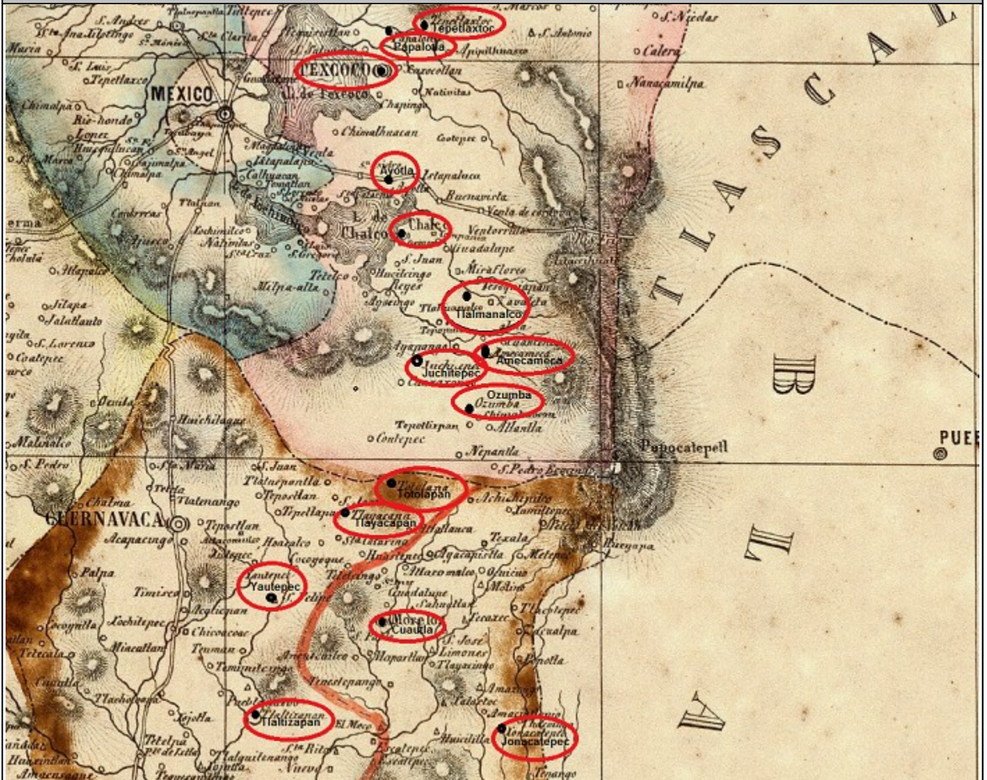
MAPA ELABORADO POR ANTONIO GARCIA CUBAS EN 1856

Distancia ( leguas según "Itinerarios y Derroteros de 1856" ): de Chalco: a Tepetlaxtloc 13; a Papalotla 11; a Tezcoco 8; a Ayotla 3; a Tlailmanalco 4; a Amecameca 7; a Ozumba 10; Juchitepec 6; Totolapan 12; Tlayacapan 14; Yautepec 19; Cuautla 16; Jonacatepec 26; Tlaltizapan 24